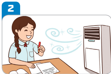
2 시원하게 지낸다.