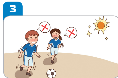
3 더운 시간대에 휴식을 취한다. (운동장 등 실외활동을 자제한다.)