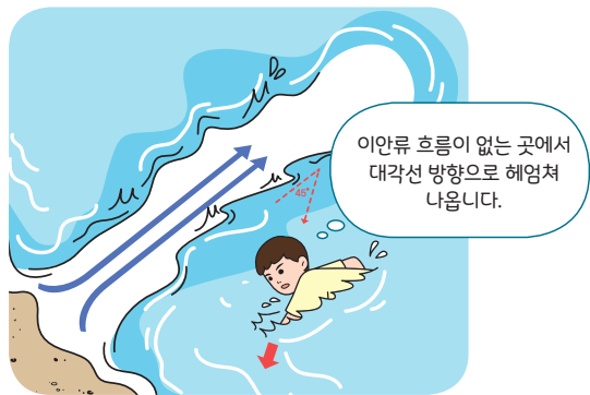
< 이안류 탈출 요령 >