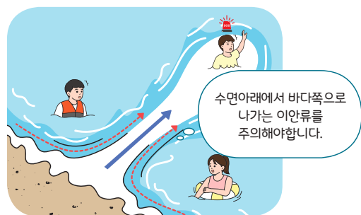
< 이안류(거꾸로 치는 파도) >