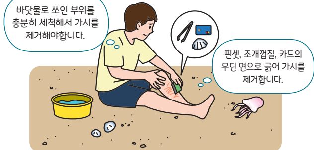
< 해파리에 쏘인 경우 대처요령 >